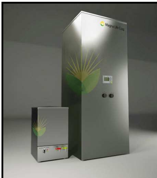
PLANTA DE BODIESEL