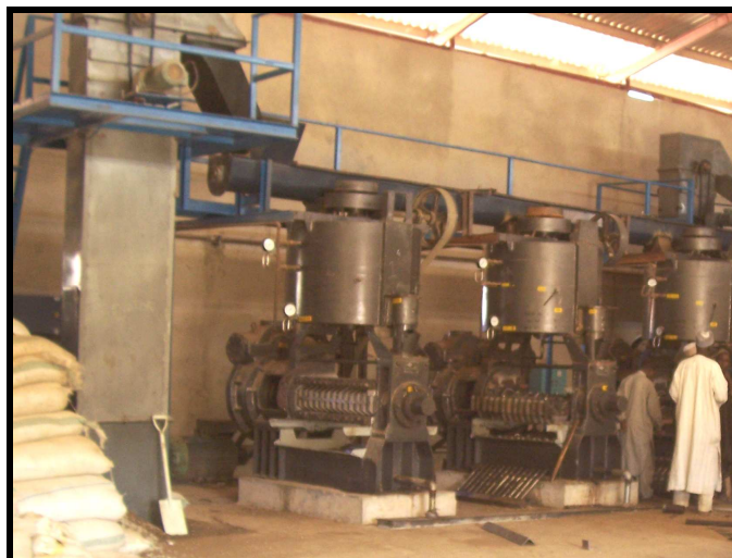
PLANTA DE EXTRACCION DE ACEITE

Además se obtiene 2320 Tn/año de expeler de calidad comercial apto como base alimenticia con alto contenido proteico y de materia grasa (6%) es un producto muy requerido en el mercado actual.